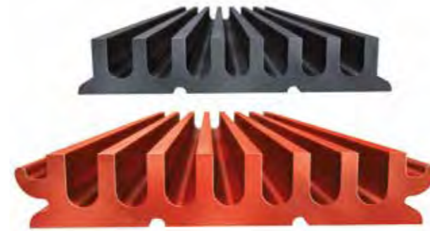
MEARIN PG EVO

Ontdek het verdere productportfolio van MEA Watermanagement