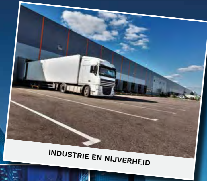
INDUSTRIE EN NIJVERHEID