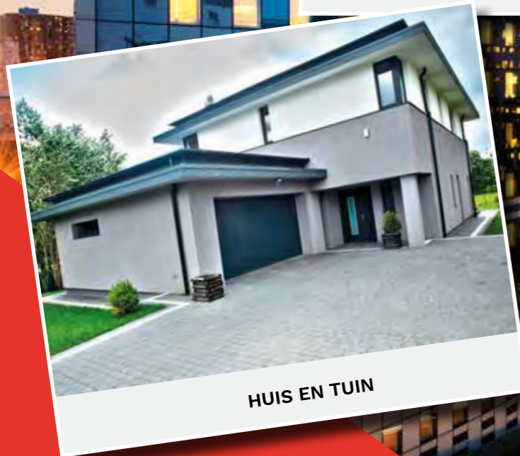
HUIS EN TUIN