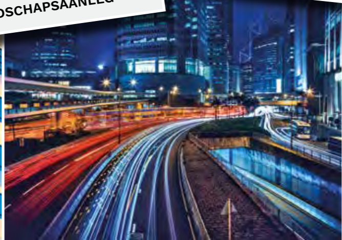
STRATEN EN WEGEN