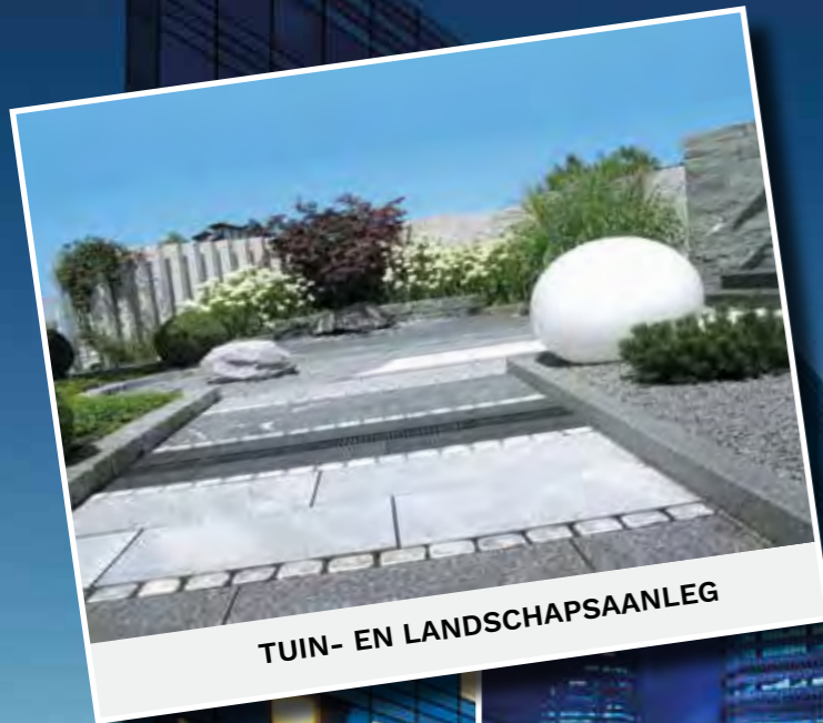
TUIN- EN LANDSCHAPSAANLEG